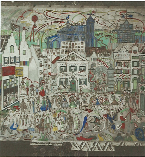
Photo rehaussée par James Ensor du décor pour La Gamme d'amour , 1921.