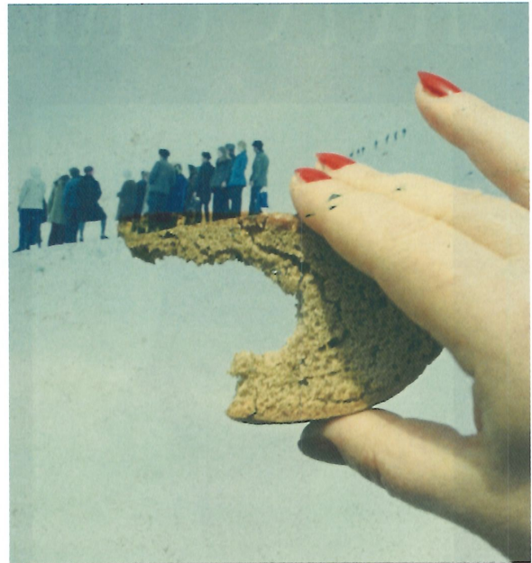
Extrait du livre Yesterday's Sandwich de Boris Mikhailov, entre 1960 et 1970.

EXPOSITION BRUXELLES PAR GWENNAËLLE GRIBAUMONT