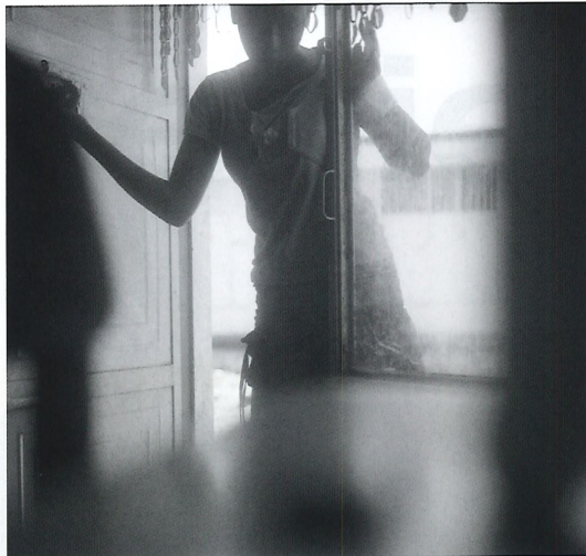
Thomas Chable Chiré, Ethiopie, 2013.