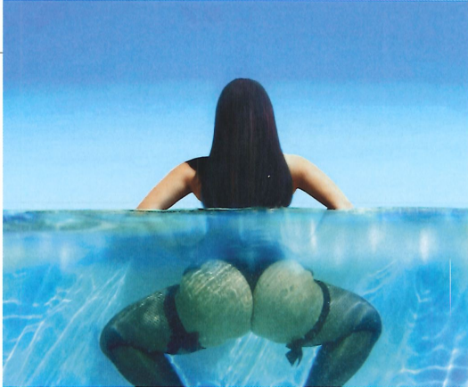
© Alison Jackson – Kim in the Pool