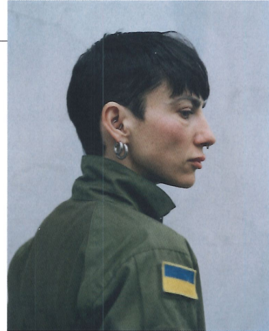
© Daria Svertilova – Irreversibly Altered

Fotomuseum aan het Vrijthof Vrijthof 18 | 6211 LD Maastricht www.fotomuseumaanhethetvrijthof.nl