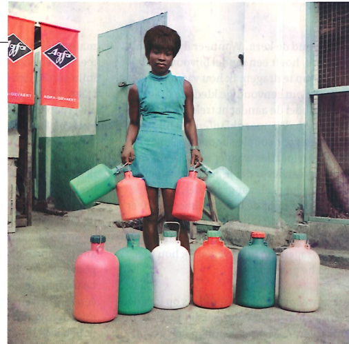
Verkoopster van Sick-Hagemeyer, Accra, 1970

Walsekaai 47 | 2000 Antwerpen www.fomu.be/expos/